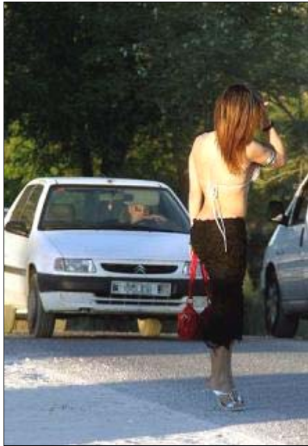
Una prostituta, en la Casa de Campo de Madrid.

a su vez, lo remitió a Madrid, ya que la menor narra graves delitos perpetrados en la capital.