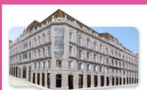
Centro Social Caixanova Policarpo Sanz, 24 - 26 Vigo

Policarpo Sanz, nº 24 - 26 36202 Vigo (Pontevedra)