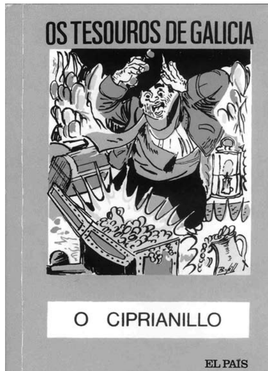
Fig. 4. “... entre as follas revésadas dese libro danse señas de tesouros e riquezas enterradas pé dos ríos e das brañas, polos mouros...” (seg. Álvarez Blázquez [1974] 2008).