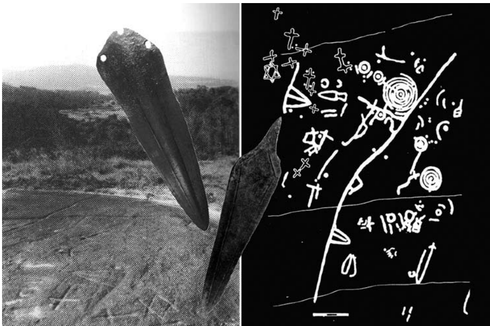
Fig. 2. Gravuras rupestres de Foxa Vella e duas alabardas provenientes do depósito do Monte Lioira, Rianxo (Decalque e fot. de Foxa Vella seg. Costas et al. 1997: 91, 108; fot. de duas das peças metálicas do depósito de Monte Lioira da autoria de B. Comendador).