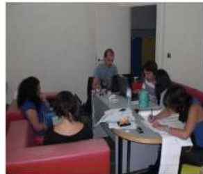
Os redactores nunha reunión de traballo

Os seus membros reclaman maior participación do estudiantado en actividades asociativas